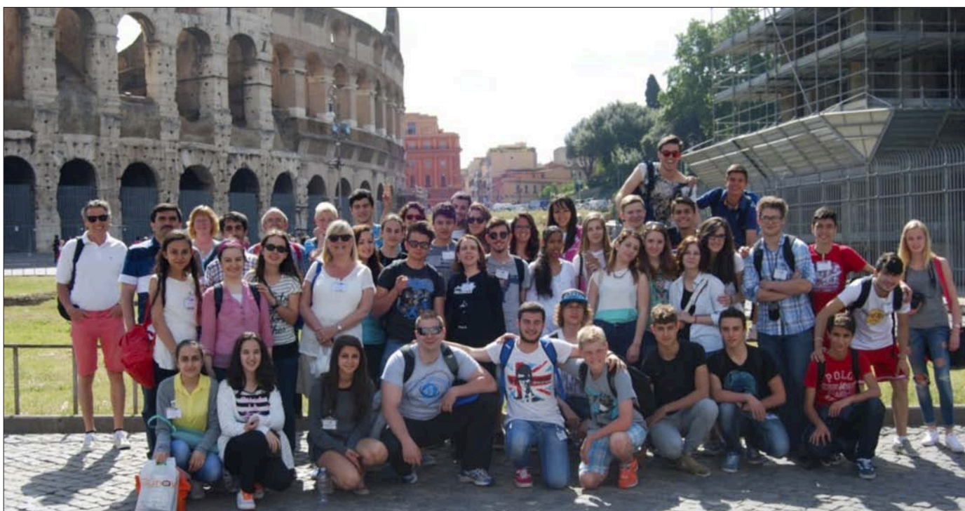
Wyjazd studyjny uczniów Zespołu Szkół Ponadgimnazjalnych nr 1 w Busku-Zdroju do Włoch w związku z realizacją programu Comenius

Znakomite wyniki osiągnięte przez uczniów m.in. na egzaminach zawodowych sprawiły, że aż dwa