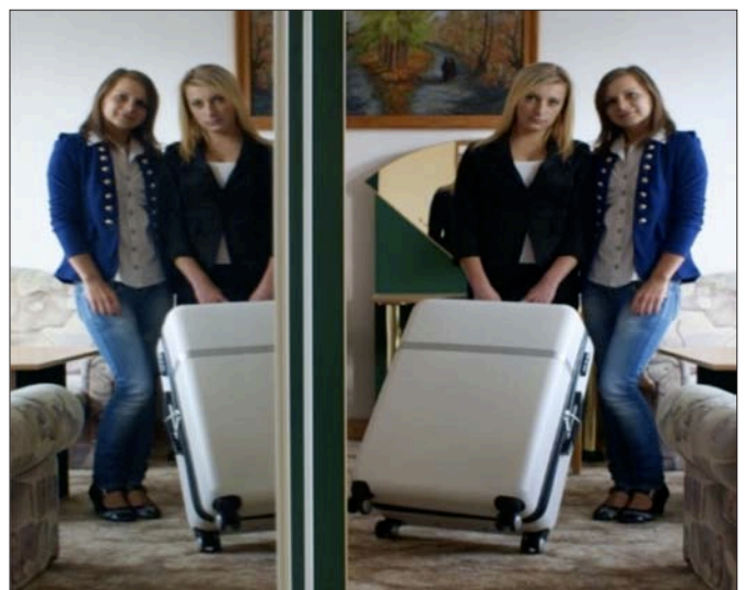
Praktyka uczniów ZSTiO w ramach programu Erasmus+ w Wielkiej Brytanii