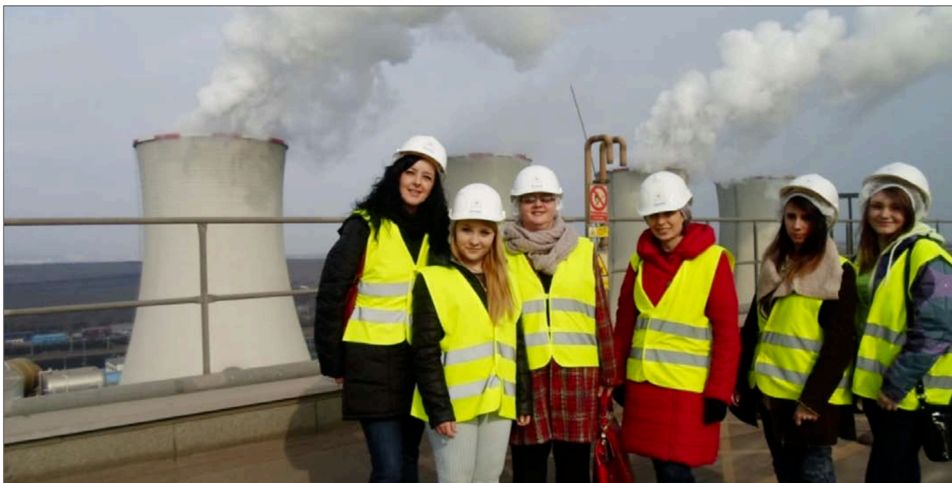
O ochronie środowiska na dachu elektrowni w Czechach – wyjazd studyjny uczniów Zespołu Szkół Ponadgimnazjalnych nr 1 w Busku-Zdroju do Czech w związku z realizacją projektu Be SUsustainable to SUsustain the WORLD w ramach programu Comenius

Intensywna nauka uczniów na teoretycznych i praktycznych zajęciach z kształcenia zawodowego