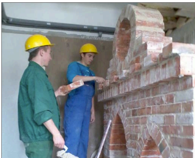
Pracownia symulacyjna praktycznej nauki w zawodach budowlanych

Współpraca ze szkołami z całej Europy to sukces Zespołu Szkół Ponadgimnazjalnych nr 1 w Busku-Zdroju. Udział młodzieży w projektach realizowanych w ramach programów Comenius oraz Erasmus+ dał im szansę na doskonalenie umiejętności posługiwania się językiem angielskim oraz technologią IT, a także poszerzenie swojej wiedzy z zakresu ochrony środowiska. Przede wszystkim są to jednak wyjazdy i spotkania z rówieśnikami z Włoch, Niemiec, Czech, Szwecji, Finlandii, Turcji, Wielkiej Brytanii, Hiszpanii.