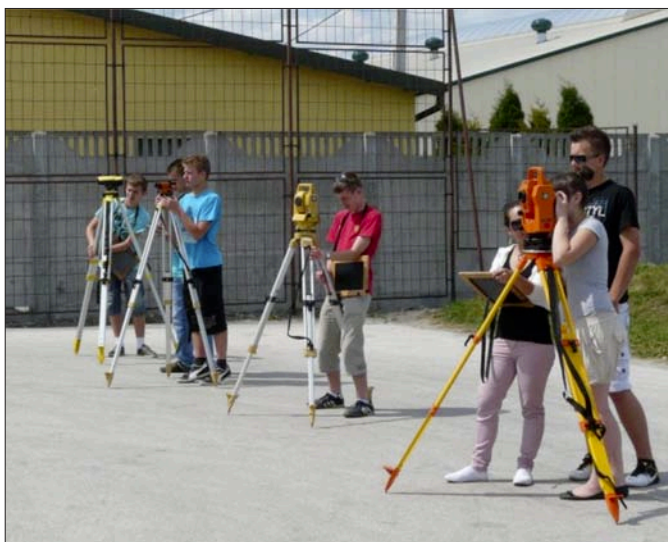
Ćwiczenia terenowe z geodezji

prowadzona przez odpowiednio przygotowaną kadrę pedagogiczną przekłada się na wyniki osiągnięte przez uczniów podczas konkursów z przedmiotów zawodowych oraz matematyki czy informatyki, a także egzaminów potwierdzających kwalifikacje w zawodzie.