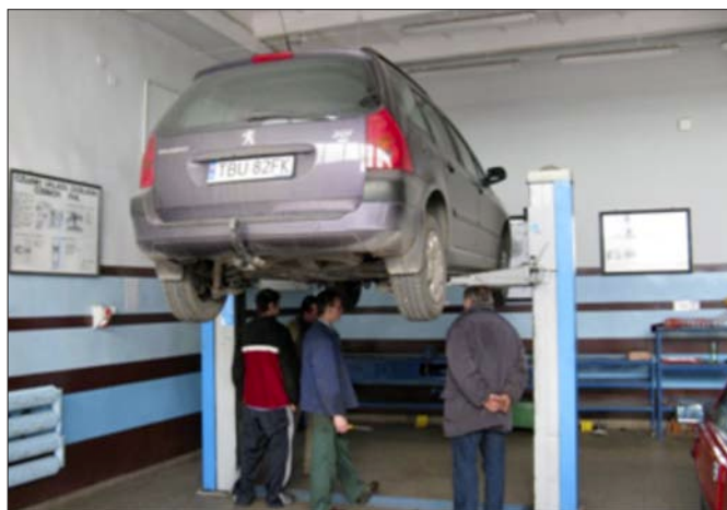
Warsztaty szkolne ZSTI

Wśród zaproponowanych kierunków kształcenia są te, które cieszą się niesłabnącym zainteresowaniem młodzieży, np.: technik informatyk, żywienia i usług gastronomicznych, hotelarstwa czy budownictwa , jak również kierunki nowo utworzone: technik chłodnictwa i klimatyzacji w ZSTiO oraz technik urządzeń i systemów energetyki odnawialnej w ZST-I . Pomysł na otwarcie nowych kierunków kształcenia wynika przede wszystkim z potrzeb rynku pracy, zarówno lokalnego, jak i regionalnego. Coraz powszechniejsze stosowanie systemów klimatyzacji w budynkach biurowych i mieszkalnych oraz w samochodach sprawi, że absolwenci kierunku chłodnictwa i klimatyzacji powinni, bez większych problemów, znaleźć zatrudnienie jako osoby odpowiedzialne za konserwację lub naprawę tych urządzeń. Zamiar uruchomienia kierunku technik urządzeń i systemów energetyki