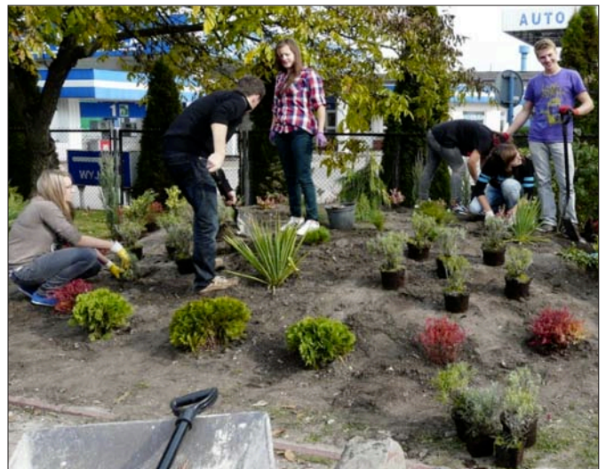
Zajęcia praktyczne w zawodzie technik architektury krajobrazu