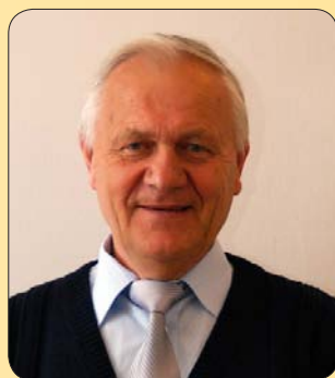
Ziolo Zbigniew Wiceprzewodniczący Rady Powiatu