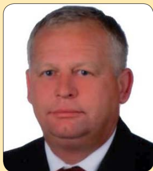
Gądek Andrzej Przewodniczący Rady Powiatu