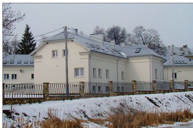
Nowy pawilon mieszkalny Domu Pomocy Społecznej w Gnojnie

Pod koniec 2012 roku zakończone zostały prace przy rozbudowie, przebudowie, nadbudowie i zmianie sposobu użytkowania budynku pralni i budynku administracyjnego z przeznaczeniem na pawilon mieszkalny dla Domu Pomocy Społecznej w Gnojnie. Wykonano również przyłącze wodociągowe oraz odprowadzenie wód gruntowych i opadowych pawilonu mieszkalnego.