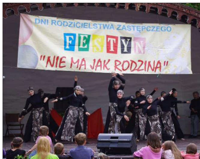
Festyn Rodzinny „Nie Ma Jak Rodzina”