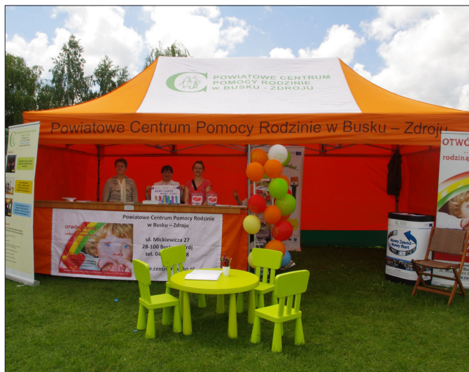
Festiwal w Pacanowie 2013 r.

tyczące działalności Centrum, w tym szczególnie rodzin zastępczych i osób niepełnosprawnych. Co-rocennie PCPR w Busku-Zdroju uczestniczy w Festiwalu Kultury Dziecięcej w Pacanowie oraz w Powiatowych Dożynkach.