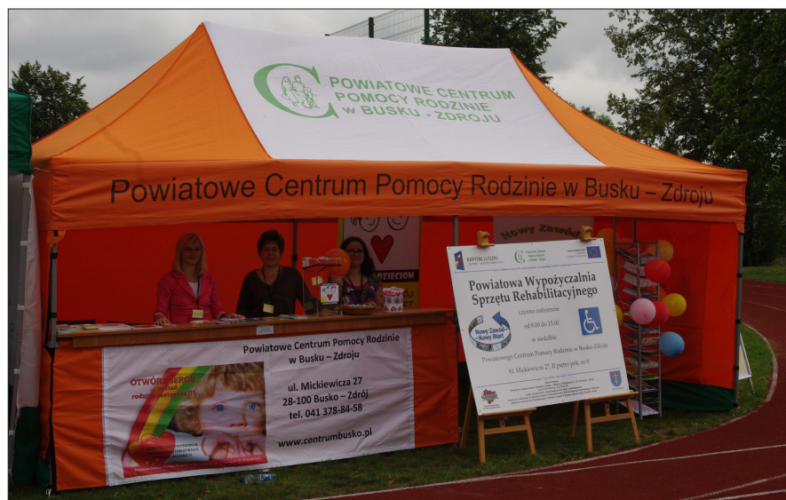
Dożynki w Stopnicy – 2012 rok