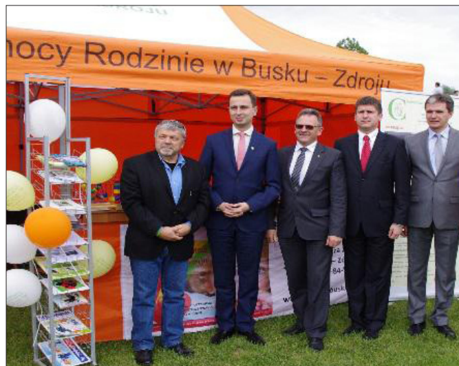
Minister Pracy i Polityki Społecznej na stoisku Centrum