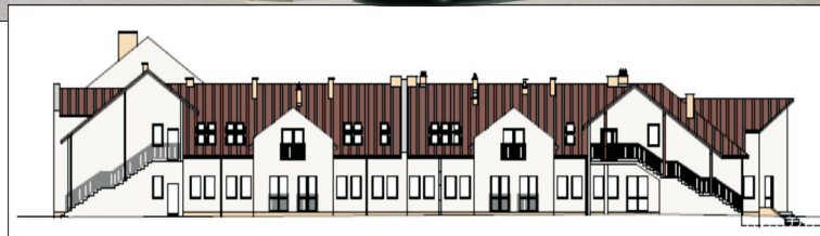
DPS w Zborowie – elewacja wschodnia istniejąca i projektowana.