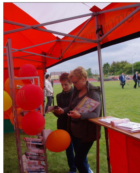
Dożynki w Gnojnie – 2013 rok