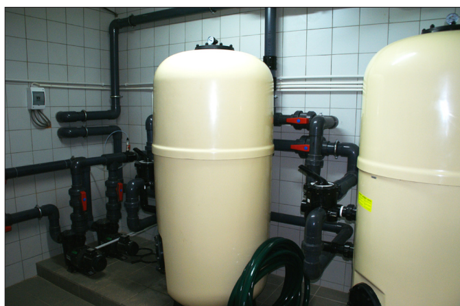
Instalacja basenowa SOSW w Busku-Zdroju

cję instalacji technologii ogrzewania, uzdatniania oraz wymiany wody istniejącego basenu rehabilitacyjnego. Wykonano również modernizację wentylacji mechanicznej w części basenowej oraz remont pomieszczeń warsztatów i sal lekcyjnych. Całkowity koszt inwestycji wyniósł 713 900,68 zł, zadanie inwestycyjne dofinansowano ze środków PFRON, będących w dyspozycji Marszałka Województwa Świętokrzyskiego w kwocie 261 184,00 zł, roboty zakończono 01.03.2012 r.