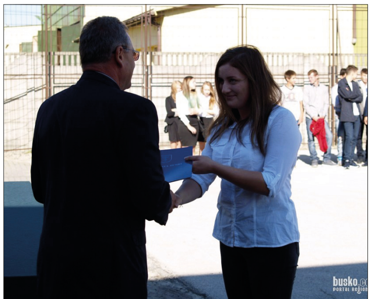
Stypendystki Zespołu Szkół Ponadgimnazjalnych Nr 1 oraz Zespołu Szkół Technicznych i Ogólnokształcących