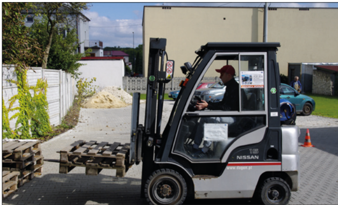
Kurs zawodowy Magazynier

PCPR mając na uwadze wzrost jakości świadczenia usług pomocy społecznej w Powiecie Buskim, wiąże duże nadzieje z nowym rozdaniem funduszy europejskich. Zdając sobie sprawę, że aplikowanie o środki i późniejsza realizacja projektów jest o wiele bardziej skomplikowana, niż miało to miejsce do tej pory, nie poprzestajemy na tym projekcie. Trwają prace nad przygotowaniem się do kolejnych naborów wniosków, które zgodnie z „Harmonogramem naboru wniosków o dofinansowanie dla RPO WŚ na lata 2014-2020” ogłaszane będą w najbliższym czasie, w tym drugiego ponadnarodowego projektu partnerskiego, który tym razem dotyczył będzie szkolenia do nowego zawodu na bazie doświadczeń z Hiszpanii.