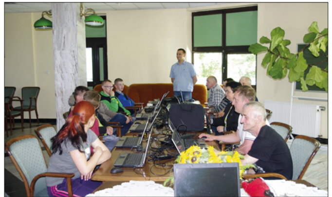
Szkolenie: Podstawy obsługi komputera z telepracą