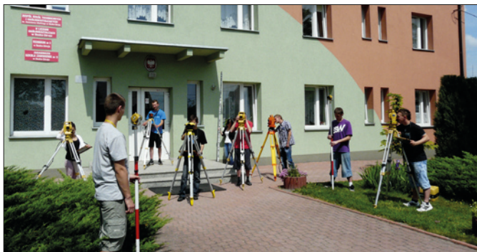
Ćwiczenia terenowe geodetów

Kolejnym atrakcyjnym kierunkiem kształcenia jest technik geodeta . Po ukończeniu tego kierunku absolwent współdziała z inżynierem geodetą przy prowadzeniu prac geodezyjnych. To zapewne najkrótsza droga do zdobycia ciekawego, dającego satysfakcję finansową zawodu.