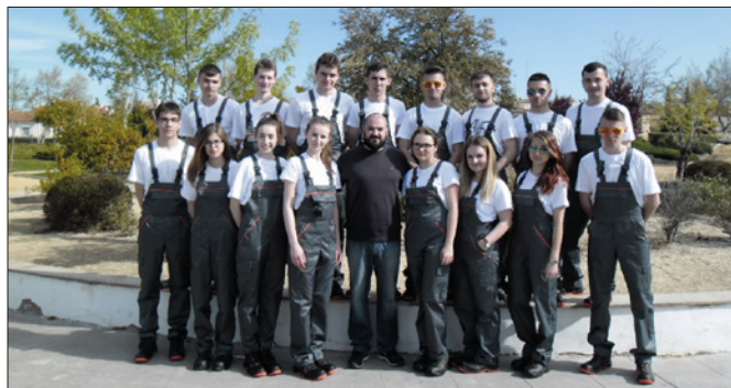
Geodeci na praktykach w Hiszpanii

W ostatnich latach szczególną uwagę przywiązuje się do aranżacji przestrzeni wokół budynków i terenów zielonych. Technik architektury krajobrazu profesjonalnie dba o tereny zielone. Łączy umiejętności projektowania z wiedzą botaniczną, a efekty pracy specjalistów z tej dziedziny możemy podziwiać zarówno w przestrzeni publicznej, jak i na prywatnych posesjach.